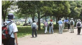
バーベキューの香りする公園内