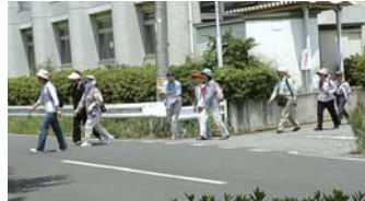
高州地区文化センター 公園は目の前