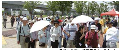
日傘も必要な好天気の中 スタート