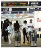
TXを利用しての参加者