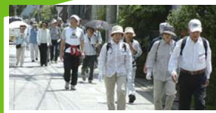
スタート直前 まだ元気