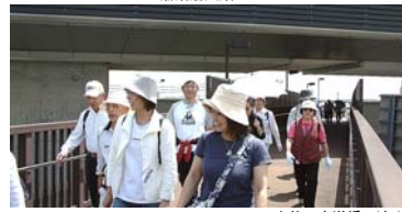
R298を谷口歩道橋で渡る