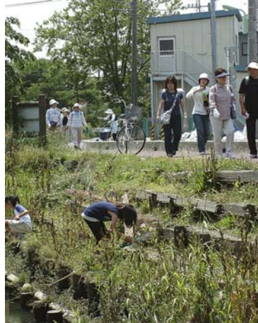
子供の水遊びを横目に