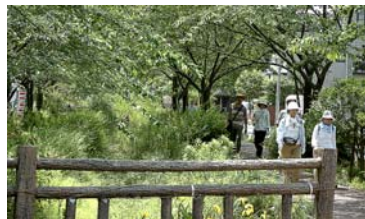
木かげが気持ちいい