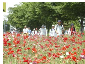
R298ポピーと別れ、公園へ