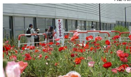
手入れ最高 吉川警察署