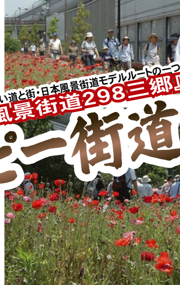
今年のポピーは最高!